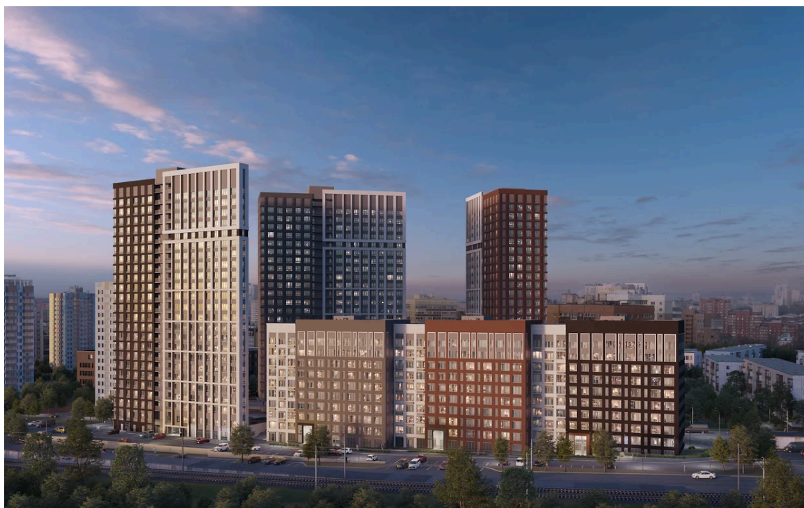
Квартал «Три Девярых» на Кронштадтской, 39

Один из крупнейших пермских застройщиков в сотрудничестве с проектным бюро ЛАД создал обновленные проекты жилых домов. В новой концепции ПЗСП готовится начать строительство дома бизнес-класса по ул. Максима Горького, 10, и уже возводит жилой комплекс «Три Девярых» на ул. Кронштадтской, 39. Проекты отличаются эффектным сочетанием монолитно-каркасных и ВАУМ-технологий, а также современным внешним обликом.