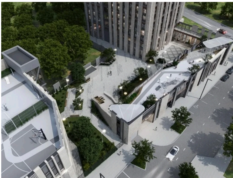
Фото: Японский девелопер YuniKa построит на ул. Толмачева высотный жилой комплекс

Членам регионального градсовета представили концепцию многоэтажного дома от девелопера YuniKa на месте долгостроя по ул. Толмачева, 3. Этот недостроенный объект с участком YuniKa несколько лет назад приобрела у пермского, ныне обанкротившегося застройщика «Трест №14». Теперь завершением здания будет заниматься структура YuniKa — ООО СЗ «Юника Окулова».